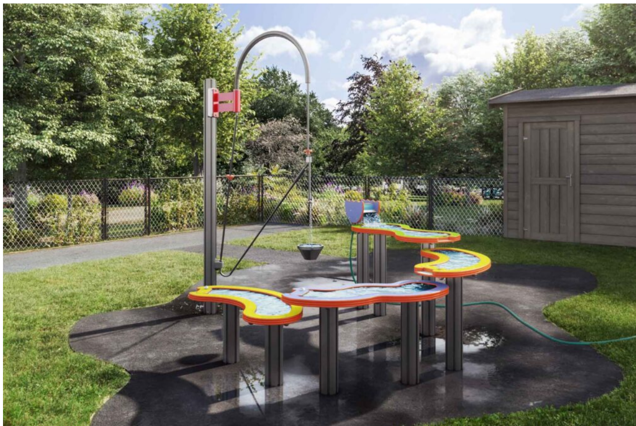
Vannrenne – system med fossefall og heisekran